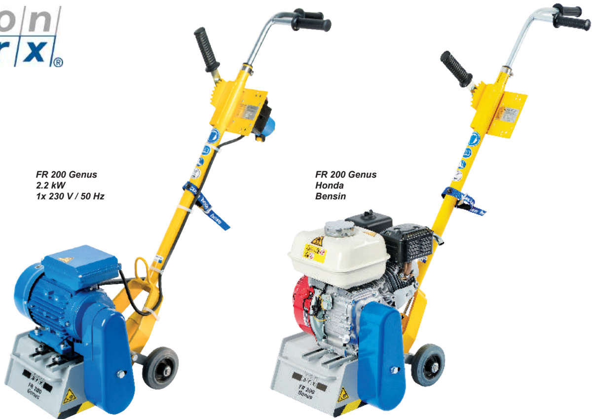
FR 200 Genus 2.2 kW 1x 230 V / 50 Hz