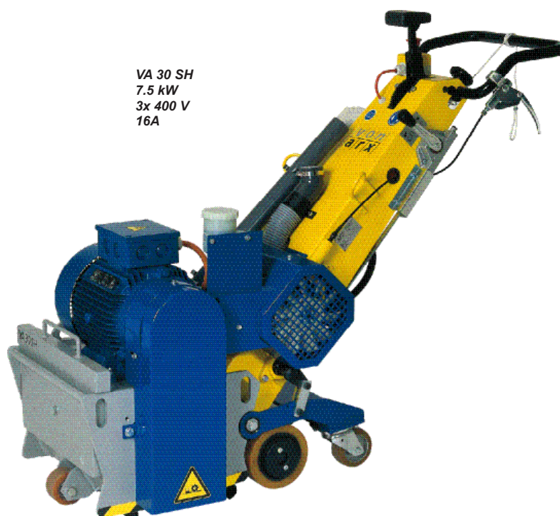
VA 30 SH 7.5 kW 3x 400 V 16A