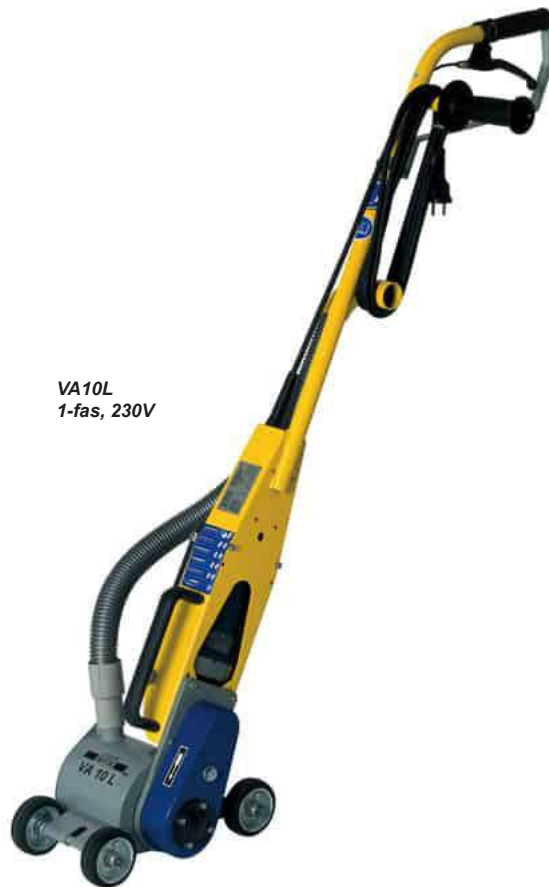
VA10L 1-fas, 230V