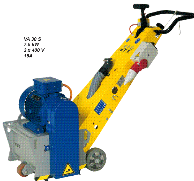
VA 30 S 7.5 kW 3 x 400 V 16A